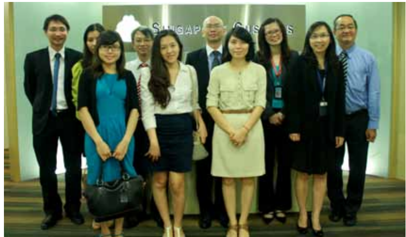
Đoàn cán bộ Việt Nam tại Hải quan Singapore

Phòng Thương mại quốc tế Singapore (SICC) chịu trách nhiệm cấp Giấy chứng nhận nguồn gốc xuất xứ không ưu đãi và nguồn gốc xuất xứ ưu đãi của Khối thịnh vượng chung các quốc gia. Hệ thống chứng nhận nguồn gốc xuất xứ (C/O) của SICC là hệ thống đã được tin