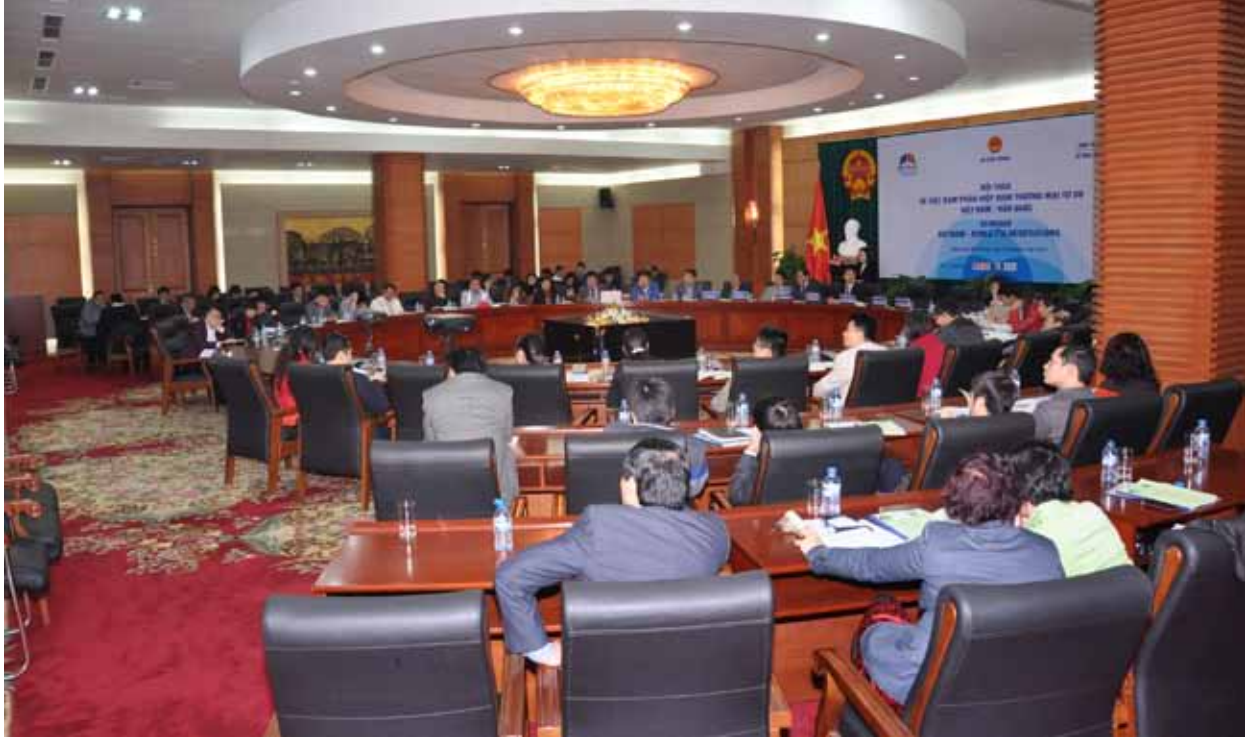
Toàn cảnh Hội thảo tại TP. Hải Phòng ngày 23/01/2013

Ngày 18/01/2013 tại TP Cần Thơ và ngày 23/01/2013 tại TP Hải Phòng, Bộ Công Thương phối hợp với Dự án EU-MUTRAP tổ chức Hội thảo về đàm phán hiệp định thương mại tự do Việt Nam - Hàn Quốc. Hội thảo được tổ chức theo tinh thần Quyết định số 06/2012/QĐ-TTg của Thủ tướng Chính phủ về việc tham vấn cộng đồng doanh nghiệp về các thỏa thuận thương mại quốc tế, đồng thời nhằm giúp các doanh nghiệp Việt Nam và Hàn Quốc hiểu rõ hơn về kế hoạch đàm phán Hiệp định FTA Việt Nam - Hàn Quốc.