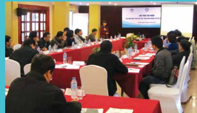
Toàn cảnh Hội thảo tập huấn “Các hoạt động thúc đẩy phát triển công nghiệp hỗ trợ tại địa phương”

Các bài trình bày tại Hội thảo cung cấp thông tin cập nhật về thực trạng và triển vọng phát triển công nghiệp hỗ trợ Việt Nam, giới thiệu và khuyến nghị các hoạt động hỗ trợ và thúc đẩy doanh nghiệp sản xuất công nghiệp hỗ trợ tại địa