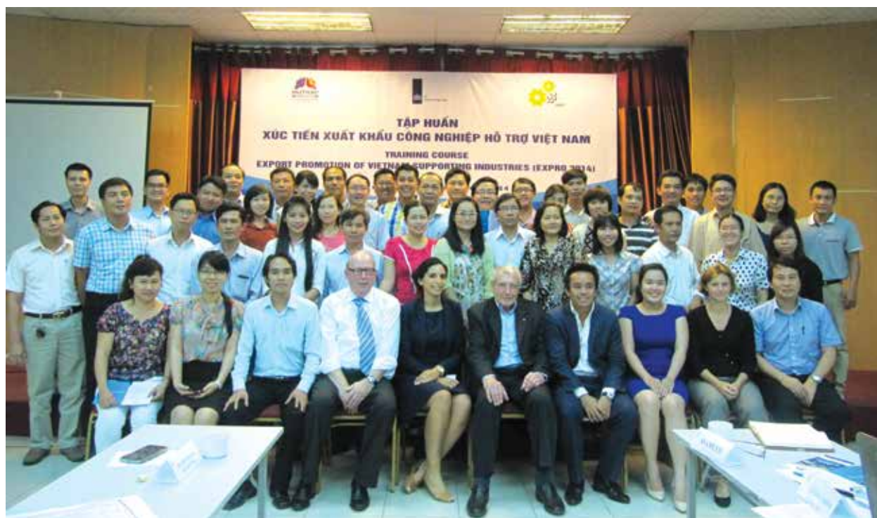
Các giảng viên và học viên của khóa tập huấn “Xúc tiến xuất khẩu công nghiệp hỗ trợ Việt Nam”

Các ngày tiếp theo, học viên được tiếp cận với các Yêu cầu về chứng nhận và quy trình chứng nhận các tiêu chuẩn của thị trường châu Âu do chuyên gia đến từ Công ty TUV Nord Việt Nam giảng dạy; các nội dung đàm phán và ký kết hợp đồng xuất khẩu do chuyên gia là thành viên trọng tài quốc tế giảng dạy. Ngoài ra, các học viên được thăm doanh nghiệp điển hình trong ngành để học hỏi kinh nghiệm thực tế trong sản xuất và xuất khẩu.