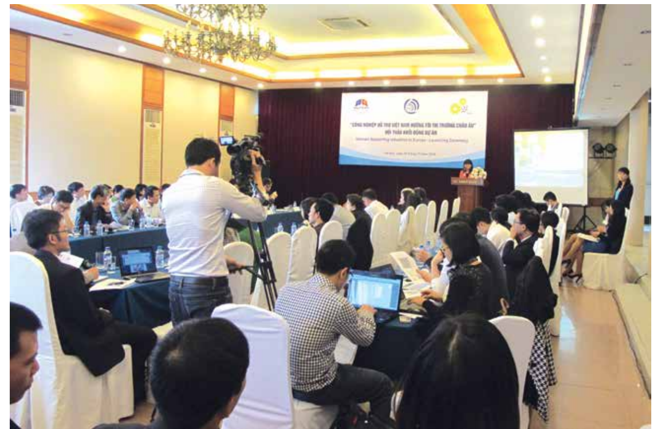
Toàn cảnh buổi lễ khởi động tiểu dự án “Công nghiệp hỗ trợ Việt Nam hướng tới thị trường châu Âu”

năng lực các ngành công nghiệp hỗ trợ, đây là kết quả đầu tiên và rất quan trọng cho các hoạt động tiếp theo của Dự án. Ngoài ra, chuyên gia của Cơ quan xúc tiến nhập khẩu từ các nước đang phát triển thuộc chính phủ Hà Lan (CBI) - đối tác châu Âu chính của dự án, đã có tham luận về thông tin thương mại và các yêu cầu khi tiếp cận thị trường châu Âu đối với các ngành công nghiệp hỗ trợ.