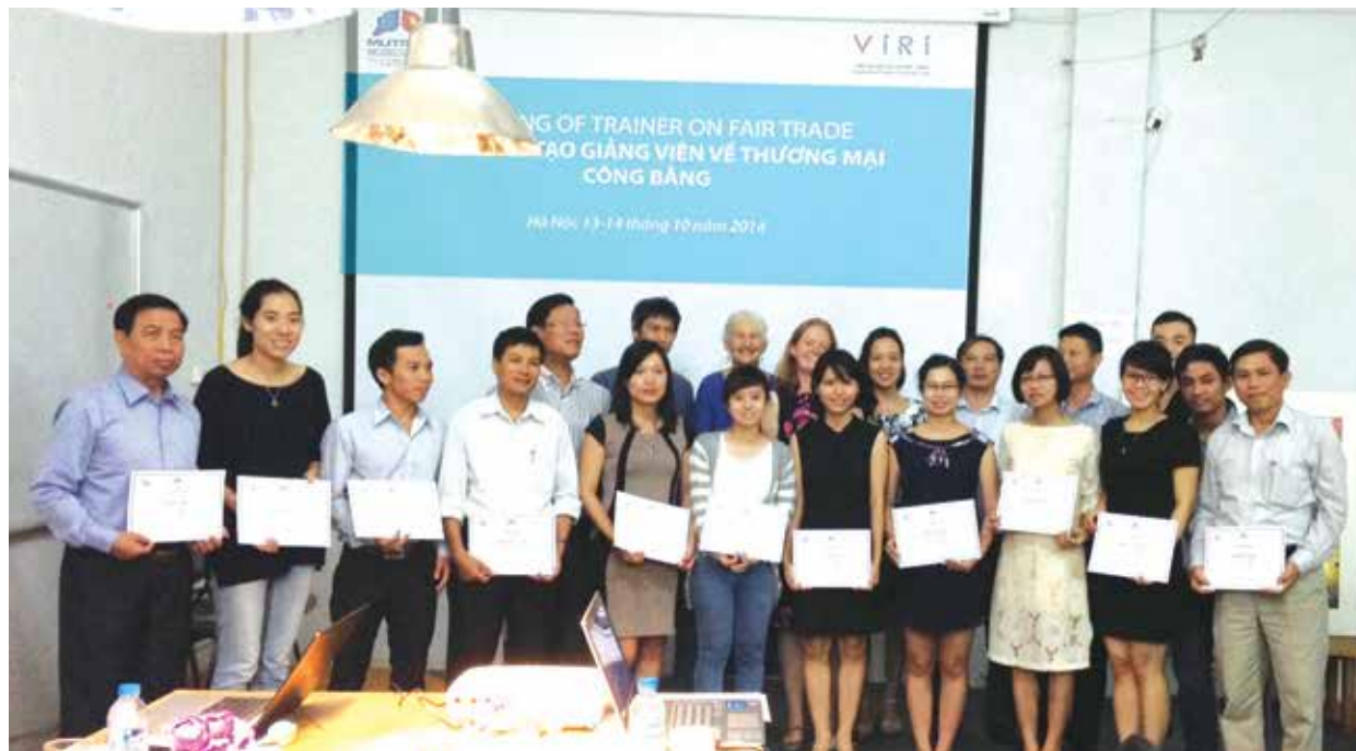
Các giảng viên và học viên của khóa đào tạo giảng viên về Thương mại công bằng

Tham dự lớp học là hơn 20 đại biểu đến từ các hiệp hội chè, cà phê-ca cao, thủ công mỹ nghệ, các lãnh đạo và các cán bộ từ các trung tâm xúc tiến thương mại miền Trung, Quảng Nam, Đà Nẵng, Đắk Lắk, và Cục Xúc tiến thương mại (Bộ Công Thương). Dưới sự hướng dẫn của 2 giảng viên cao cấp đến từ Tổ chức Thương mại công bằng thế giới (WFTO), các học viên đã được trang bị những kiến thức nền tảng về những lợi ích, quy trình đạt được chứng nhận thương mại công bằng của WFTO và một số nội dung khác.