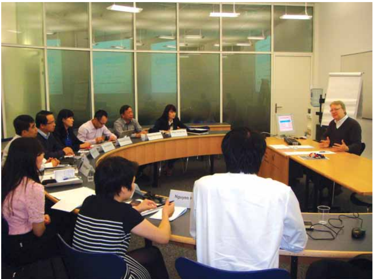
Đoàn cán bộ Việt Nam tại khóa đào tạo

Khóa đào tạo đã góp phần tăng cường năng lực của các cán bộ chính phủ trong các hoạt động đàm phán sắp tới./.