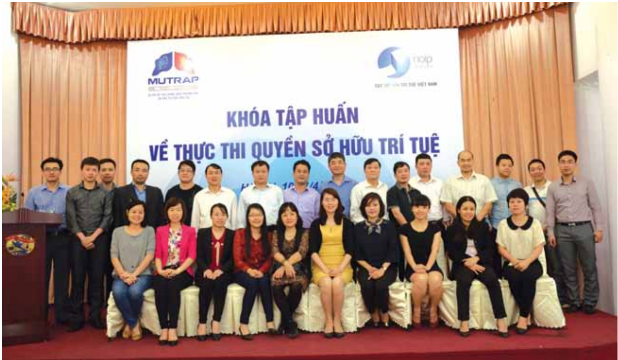
Các học viên tham dự khóa tập huấn về thực thi quyền sở hữu trí tuệ