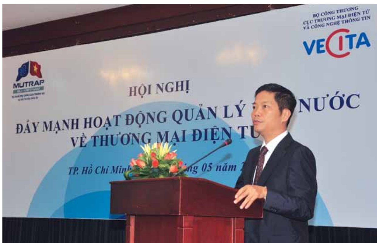
Ông Trần Tuấn Anh - Thứ trưởng Bộ Công Thương phát biểu khai mạc hội thảo